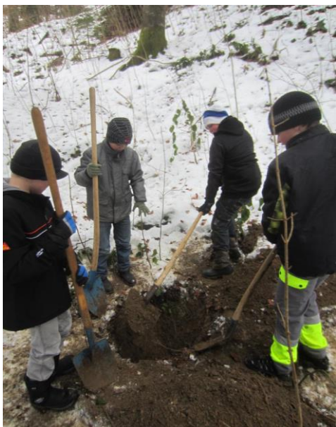
Gruppenstunde "Schatz vergraben"

Die Jungwacht wird finanziell und materiell unterstützt von der Gemeinde Schüpfheim und der katholischen Kirchgemeinde. Anlässe wie Brunch und Racletteabend sind weitere Einnahmequellen. Die Jungwacht ist bemüht den Beitrag welchen die Eltern zu bezahlen haben tief zu halten. So beträgt der Anfangs Kalenderjahr eingezogene Mitgliederbeitrag 50 Fr. Die Kosten für das Sommerlager betragen voraussichtlich 220 Fr.