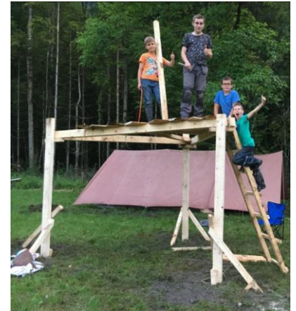
Turm der Gruppe „Raptors“ im Sommerlager 2017