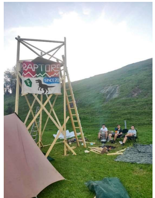
Turm der Gruppe „Raptors“ im Sommerlager 2022