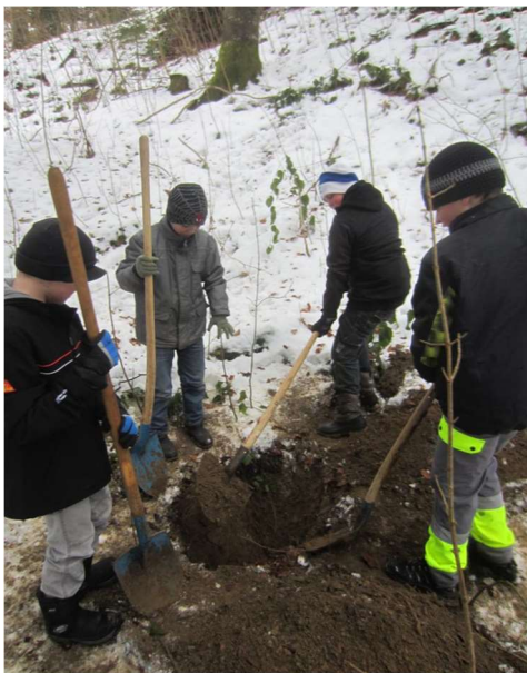
Gruppenstunde "Schatz vergraben"

Die Jungwacht wird finanziell und materiell unterstützt von der Gemeinde Schüpfheim und der katholischen Kirchgemeinde. Anlässe wie Brunch und Racletteabend sind weitere Einnahmequellen. Die Jungwacht ist bemüht den Beitrag welchen die Eltern zu bezahlen haben tief zu halten. So beträgt der Anfangs Kalenderjahr eingezogene Mitgliederbeitrag 50 Fr. Die Kosten für das Sommerlager betragen voraussichtlich 220 Fr.